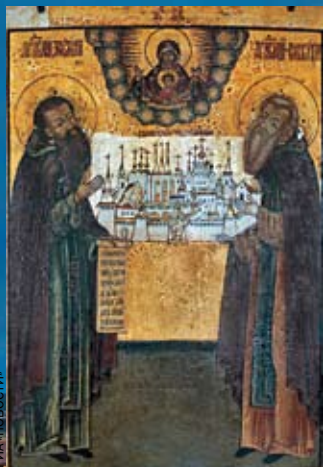
Преподобные Зосима и Савватий Соловецкие