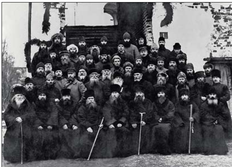
Группа заключенных Соловецкого лагеря особого назначения (СЛОНа) 1925 год.

слышен всей России. В мае 1926 года духовенством СЛОНа составлено знаменитое «Обращение православных епископов из Соловецких островов к правительству СССР», в котором были изложены принципы, определяющие отношение Церкви к государству. До 1929 года на Соловках еще проводились богослужения. После закрытия монастыря около 60 человек братии добровольно остались в лагере в качестве вольнонаемных. Они совершали богослужения в церкви преподобного Онуфрия Великого на монастырском кладбище. С 1925 года в них было разрешено принимать участие и заключенным. «Службы в Онуфриевской церкви нередко совершали по несколько епископов, — пишет писатель и соловецкий зек Олег Волков . — Священники и диаконы выстраивались шпалерами вдоль прохода к алтарю... Богослужения были приподнято-торжественными... ибо все мы в церкви воспринимали ее как