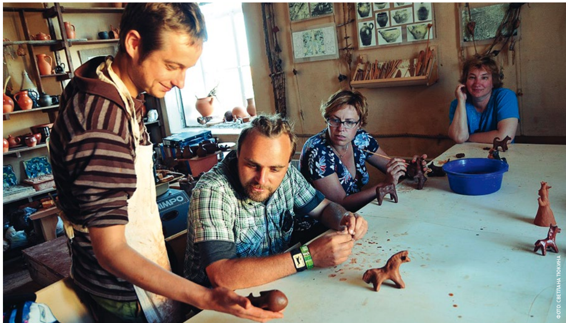
Автор: Екатерина Лапина

Летом 2014 года на Соловках прошла «Летняя школа» САФУ. Ее участниками стали студенты двух институтов — естественных наук и технологий и социально-гуманитарных и политических наук.