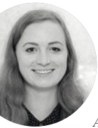
Автор: Яна Рубина

Научно-образовательная связь между Архангельском и Соловками усиливается. На архипелаг снаряжают все больше экспедиций студентов, молодых ученых и преподавателей.