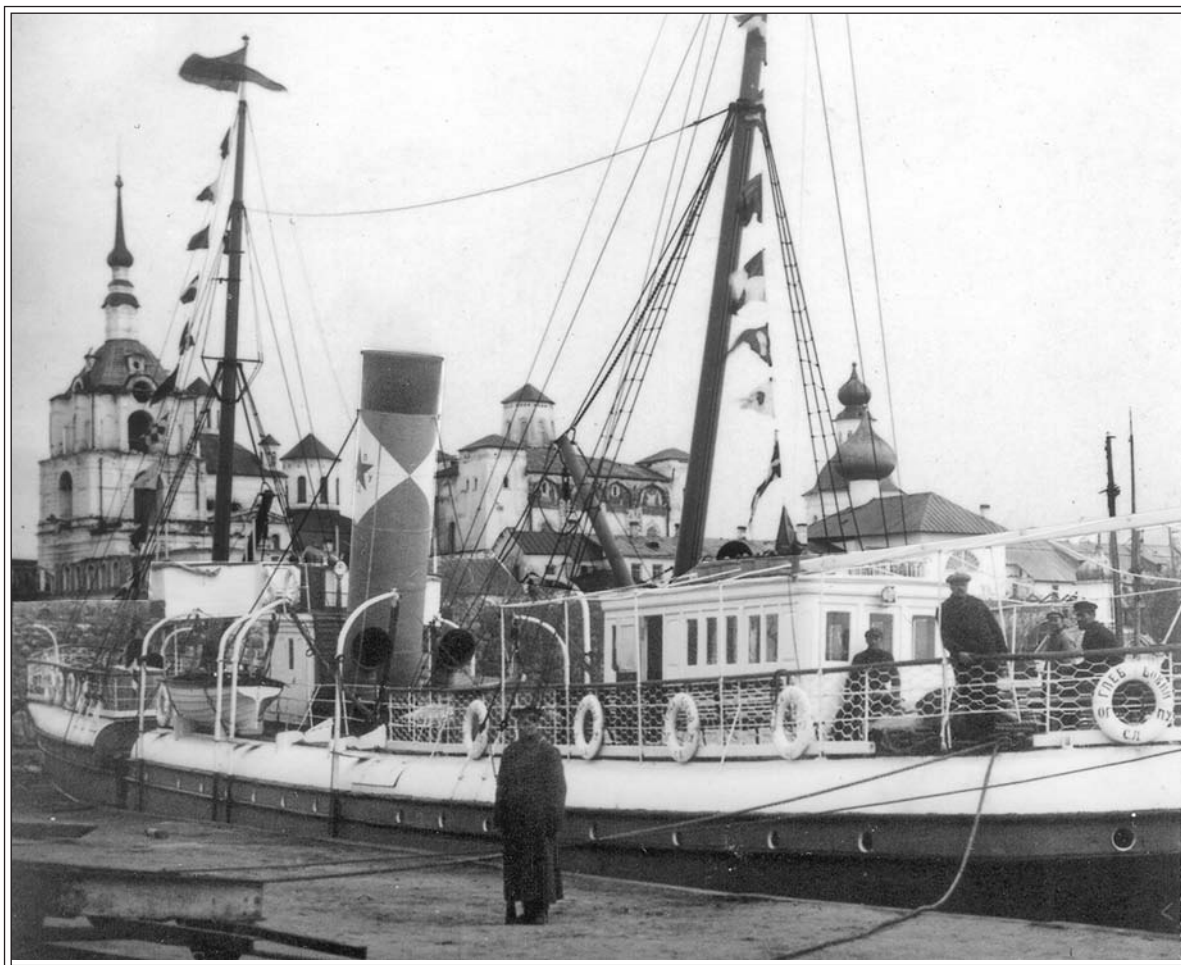
Пароход «Глеб Бокий». 1920-е гг.

произведено вскрытие мощей преподобных Иринарха и Германа, Зосимы и Савватия 41 .