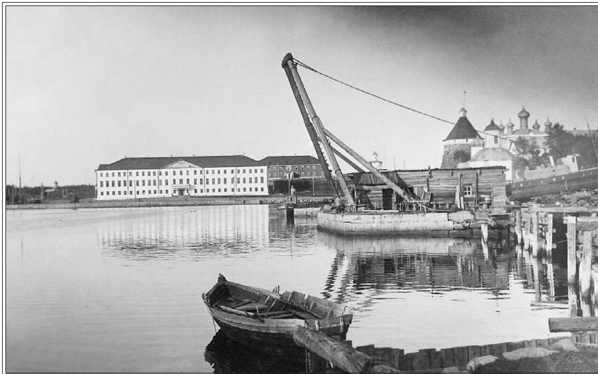
Преображенская гостиница, в которой размещалось Управление лагеря. 1925 г.

1–2 роты — заключенные, работающие в лагерной администрации (старосты, заведующие разными производствами и предприятиями), ценные специалисты (в 1929 г. на административно-хозяйственных должностях было 1190 заключенных). Прачечный корпус;