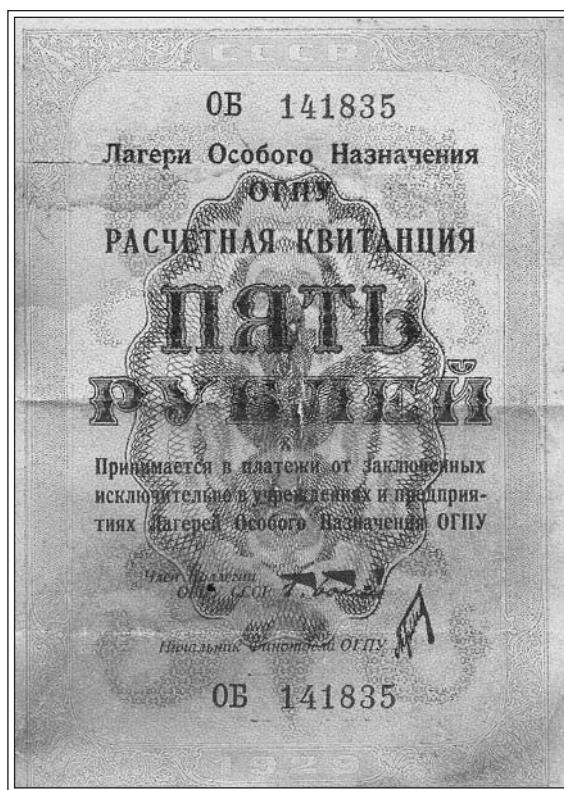
Расчетная квитанция для лагерей особого назначения. Выпуск 1929 г. с подписью члена КОГПУ Г. Бокия

1997, 27 октября — в урочище Сандармох, в 16 км от Медвежьегорска, на месте расстрела в 1937–1938 гг. более 6 тысяч человек, в т.ч. 1111 заключенных Соловецкой тюрьмы, открыто мемориальное кладбище. На церемонии присутствовали родственники погибших, члены Государственной Думы, представители