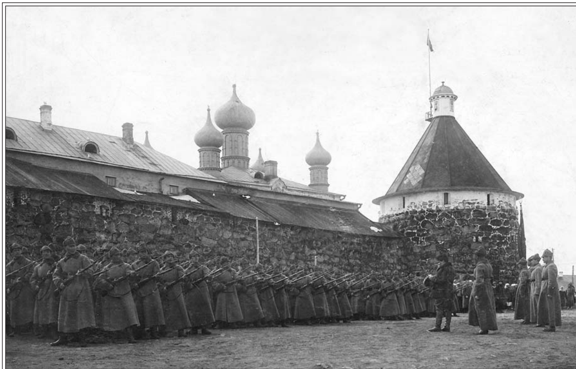
Парад 1 мая. Б/г.

ингушей — 26, калмыков — 23, караимов — 5, тюрков — 198, сартов — 8, молдаван — 9, итальянцев — 2, бурят — 5 93 .