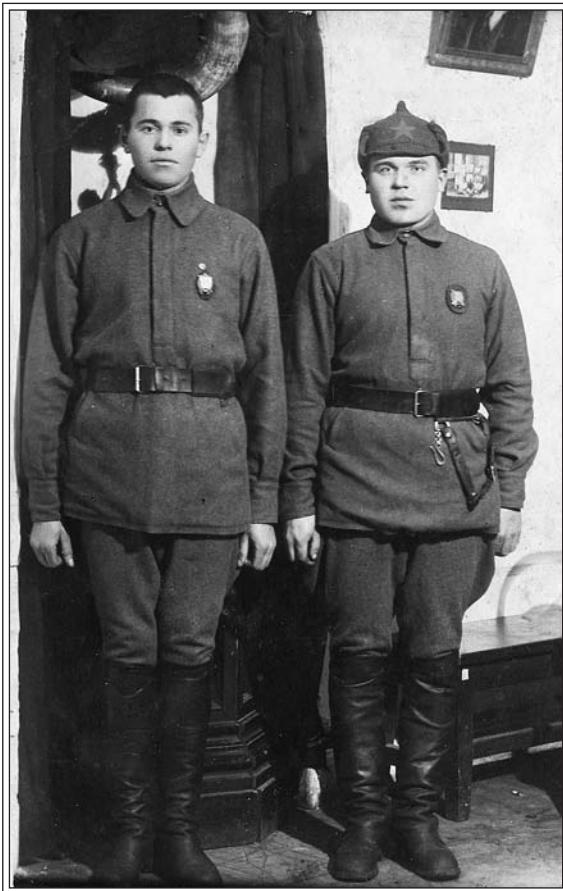
Красноармейцы в СЛОНе. Б/г.

1926, сентябрь — международный комитет Красного Креста в лице председателя Густава Адора обратился с просьбой предоставить возможность его уполномоченным представителям в Москве осмотреть СЛОН. Просьба рассматривалась на заседании совещания при Исполнительном Комитете Союза обществ Красного Креста. А.С. Енукидзе написал Г. Адору: «Что касается Соловков, то там в настоящее время находятся только уголовные преступники» 50 .